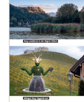
Burg Landskron in der Region Wörthersee

GEMEINSAM GUTES TUN STÄRKT DEN TEAMGEIST Nachhaltigkeit und Corporate Social Responsibility liegen in Kärnten grundsätzlich nicht nur im Vordergrund, mit dem Maximalen Kräfte von Kärnten Convention. Durch die Kooperation mit lokalen Sozialprojekten können Unternehmen individuelle Möglichkeiten, die CSR Teams von bis hin zu kleinen Projekten zu realisieren. Die Corporate Volunteering Aktionen stärken nicht nur den Teamgeist, sondern belohnen die Teilnehmer mit der Erfahrung, bei Ausflügen mit Senioren oder Menschen mit Behinderungen, Workshops mit Jugendlichen und Kindern sowie bei aktiven Naturschutz-Projekten-Gates für seine Mitmenschen und die Umwelt ganz zu haben.