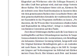
Slow Food Experience in der Region Wörthersee